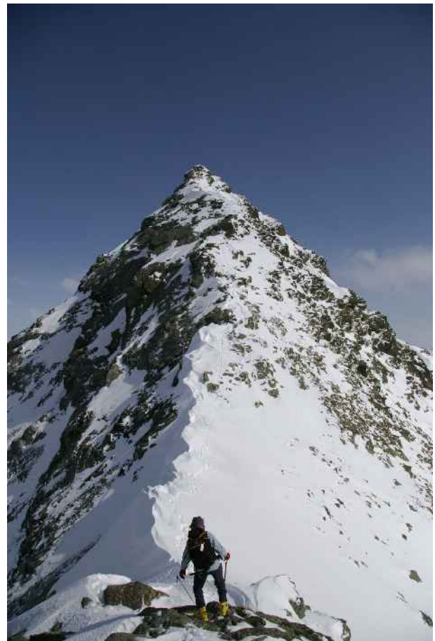
La cresta finale dal passo a quota 2900.