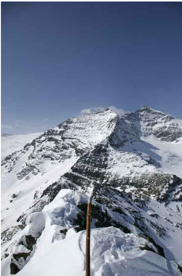
Dalla vetta verso il Piz Cambrena.